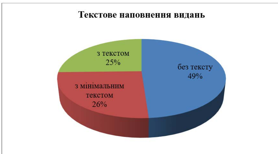
Діаграма 3. Текстове наповнення видань