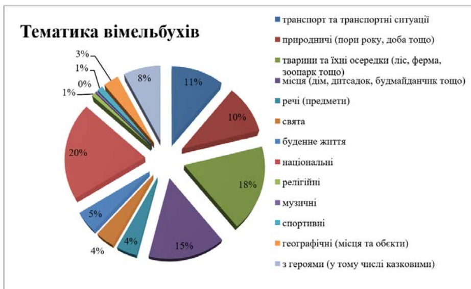
Діаграма 2. Тематика вімельбуків