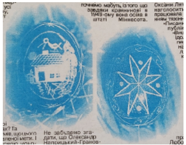
Рис. 1. Ілюстрація до публікації Фарина І. Розповідають писанки про долі. Діалог . 2010. 2 квіт. С. 8