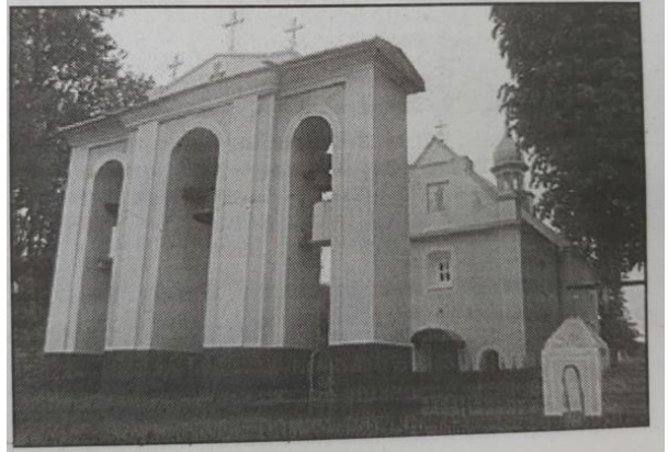
Рис. 1. Ілюстрація до публікації Сушко М. Наша святиниця. Воля . 2015. 10 лип. С. 3.