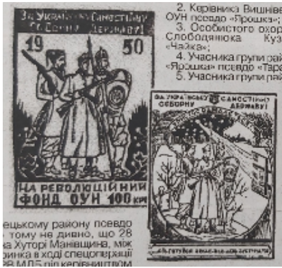
Рис. 1. Ілюстрація до публікації Олійніченко В. Пам'яті героїв. Діалог . 2010. 25 черв. С. 3