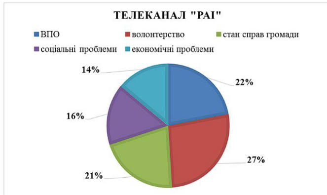
Рис. 3. Результати аналізу новинного контенту ТРК «РАІ» (за період 01.01.2023 — 31.12.2023)

За січень 2024 року ТРК «РАІ» опублікувала 298 новинних сюжетів на різноманітну тематику: