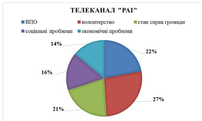
Рис. 2. Результати аналізу новинного контенту ТРК «РАІ» (за період 15.03.2022 — 30.05.2022)

Загалом кількісний аналіз новинних сюжетів телеканалу «РАІ» у проблемно-тематичному розрізі продемонстрував зростання упродовж березня-травня 2022 року новин соціально-економічного спектру. Більшість із них відтворюють життя громади в умовах війни (рис. 2):