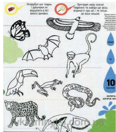
Рис 2. Приклади інфограм з книжки «Інфографіка для дітей»