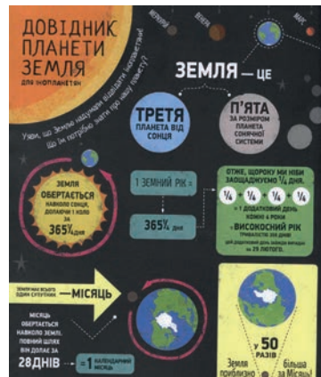
Рис 1. Приклади інфограм з книжки «Інфографіка для дітей»