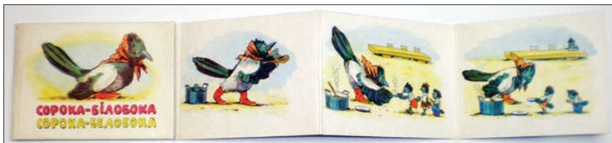
Ілюстрація № 6 «Сорока-Білобока»

Через ілюстрацію до книжки малюк засвоює форму та величину предметів, розташування в просторі та часі. В цей період дитина вже може об'єднувати предмети за спільними ознаками, розвивається активне мовлення. Тому ілюстрації до книжок мають бути предметними, що дасть змогу дітям зосередитися на окремих предметах, вивчити їх форму, властивості, розміщення в просторі. Малюнок окремого предмета, поданий ізольовано, допомагає зосередити увагу дитини не тільки на назві предмета, а й на назвах його ознак, частинах, на визначенні словами його кольору, форми, розміру. При розробленні тематики книжок-іграшок слід використовувати програми виховання та розвитку дітей раннього віку, затверджені Міністерством освіти і науки України.