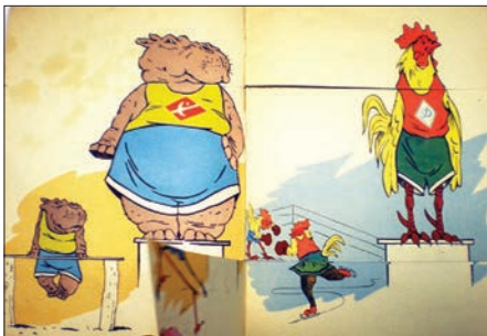
Ілюстрація № 9 «Чемпионы»

В книжках можуть зустрічатися й ігрові деталі, але вони мають бути простими у використанні. В цьому аспекті книжна «Чемпионы» (див. іл. № 9, № 10, № 11, № 12) є досить цікавою за своїм форматом, художнім оформленням та неперевершена за майстерністю художника. Внутрішні сторінки книги розрізані на три смужки. Верхня та нижня смужки вузькі, центральна смужка книги більш широка. Горгаючи таку книжку, дитина розглядає не лише існуючих, хоча й персоніфікованих, тварин, а може порухом руки долучитись до створення якоїсь неіснуючої істоти, химери або до кумедної ситуації. Таку книжку можна створити і без залучення сучасних матеріалів або конструкцій, тут головне фантазія художника.