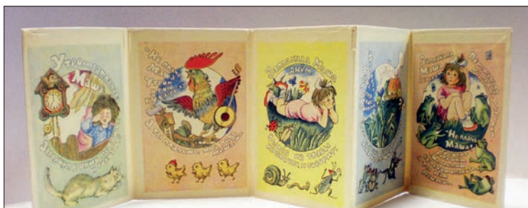
Ілюстрація № 1. «Когда можно плакать?»

В ранньому віці (1–2 роки) відбувається зародження самостійної гри, тому дитина, з якою в цей період багато грають, швидше стає самостійною, краще говорить, сама може себе розважити. В цей період відбувається стрімкий розвиток сенсорних процесів, тому бажано обирати книжки з використанням основних кольорів, що дозволить дитині ознайомитись та вивчити їх. Не варто залучати до однієї ілюстрації подібні кольори, наприклад, синій та фіолетовий. Це може збивати дитину та ускладнити процес запам'ятовування. Надмірне використання яскравих кольорів також негативно впливає на естетичну цінність книги. Фон, перевантажений яскравим або надто насиченим кольором, ускладнює процес «прочитання» ілюстрації. В книжці-ширмочці «Когда можно плакать?» (див. іл. № 1. «Когда можно плакать?») нейтральний (пастельний) фон дозволяє зосередитись на малюнку, а цікаве розміщення тексту доповнює концепцію ілюстрації. Книжки-іграшки, які використано нами для ілюстрації (унаочнення) цієї статті — з колекції Державного музею іграшки.