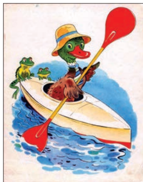
Ілюстрація № 3. «Шутки»

Біле тло в книжці-картинці «Zosia і Piotrus» (див. іл. № 4, № 5 «Zosia і Piotrus») органічно поєднано з кольоровими елементами зображення. Предмети та люди, що зображені на білому фоні, не здаються просто розміщеними в просторі та відірваними від площини. Малюнок органічний і не переобтяжений кольорами завдяки вправному виконанню.