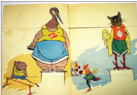
Ілюстрація № 11 «Чемпионы»