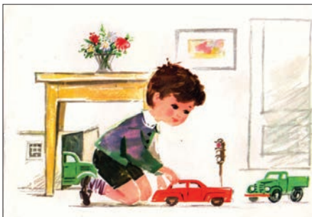
Ілюстрація № 5 «Zosia і Piotrus»

Талановитий художник спроможний створити захоплюючі ілюстрації, використовуючи невеликі формати сторінок, без надмірного насичення кольором, але з такими виразними малюнками, що не потребуватимуть супроводжуючого тексту. Так, «Сорока-Білобока» (див. іл. № 6 «Сорока-Білобока») намальована таким чином, ніби кадри мультфільму, що йдуть один за одним. Малюнок послідовний і зрозумілий без тексту.