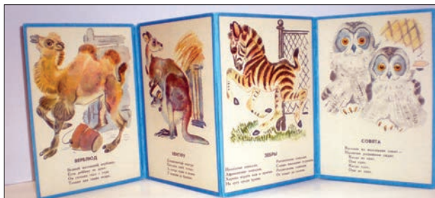
Ілюстрація № 7 «Детки в клетке»

тому потрібно книжки-ширмочки складати так, щоб діти могли користуватися ними самостійно. Адже малюку цікаво не тільки розгортати сторінки і дивитися на картинки. Ці книжки можна поставити півколом і зображення перетворяться в панораму (див. іл. № 7 «Детки в клетке»).