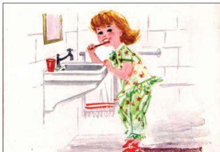
Ілюстрація № 4 «Zosia і Piotrus»

Біле тло в книжці-картинці «Zosia і Piotrus» (див. іл. № 4, № 5 «Zosia і Piotrus») органічно поєднано з кольоровими елементами зображення. Предмети та люди, що зображені на білому фоні, не здаються просто розміщеними в просторі та відірваними від площини. Малюнок органічний і не переобтяжений кольорами завдяки вправному виконанню.