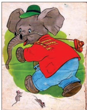
Ілюстрація № 2. «Шутки»