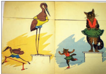
Ілюстрація № 12 «Чемпионы»

Не зважаючи на те, який у книжки формат, потрібно пам'ятати, що в цей період у дитини формується самоповага та самооцінка, і тому книжка повинна бути такою, щоб дитина змогла освоїти маніпуляцію з нею і відчувти почуття